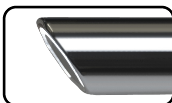
Blickwinkel Direction of view 30°