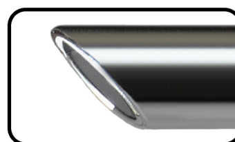
Blickwinkel Direction of view 45°

Endo doctor GmbH tale-off Gewerbepark 2 D-78579 Neuhausen ob Eck Telefon: +49-(0) 7467 - 94 51 89 0 eMail: kontakt@endo doctor .de